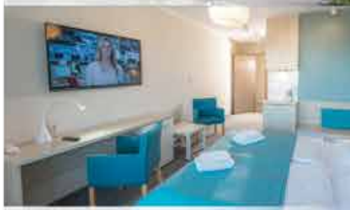
Zimmerbeispiel, 3+ Aparthotel Nad Parseta

Beratung & Buchung: 0800 - 228 42 66 gebührenfrei / Mo.-Fr.: 9-17 Uhr