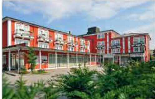
Außenansicht, 3+ Hotel Füssinger Hof

Freizeit/Kur/Unterhaltung: Entspannung finden Sie u.a. auf der Liegewiese oder in der hoteleigenen Therapieabteilung, wo Ihnen gegen Aufpreis unterschiedliche Massagen angeboten werden. In der größten Therme Deutschlands, der Johannesbad Therme, stehen Ihnen zahlreiche Becken im Innen- und Außenbereich zum täglichen Thermalbaden kostenfrei zur Verfügung.