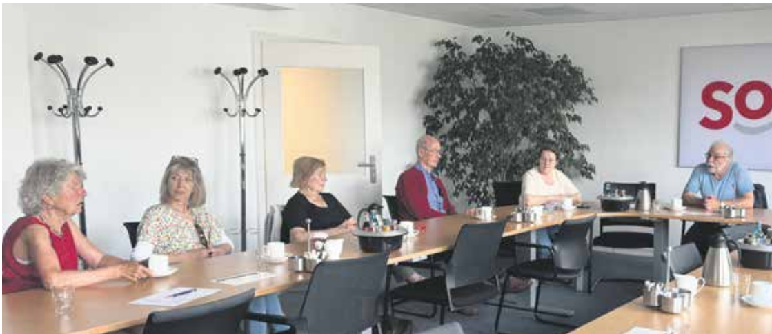
Der zunehmende Rechtspopulismus war ein Diskussionsthema auf dem Vorstandstreffen.

Vorstandstreffen des Kreisverbandes Bremen im Nordic CAMPUS