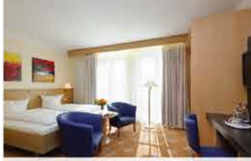
Zimmerbeispiel, 3+ Hotel Füssinger Hof