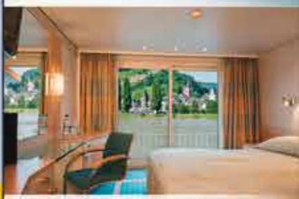
Kabinenbeispiel, 4++ VIKTORIA