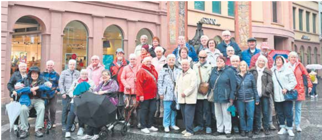
Trotz Regen genossen die Mitglieder den Tagesausflug, hier in der Mainzer Innenstadt.

Tagesausflug des Ortsverbandes Schwetzingen-Neulußheim