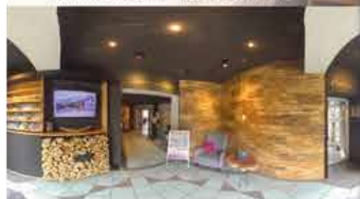
Eingangsbereich, 3+ Hotel Dein Franz