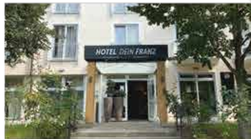
3+ Hotel Dein Franz

Freizeit/Kur/Unterhaltung: Die hauseigene Physiotherapiepraxis bietet Ihnen gegen Aufpreis erholsame und wohltuende Anwendungen. Oder Sie nutzen den Fahrradverleih (gg. Gebühr) im Hotel, um das herrliche Rottaler Bäderdreieck aktiv zu erkunden.