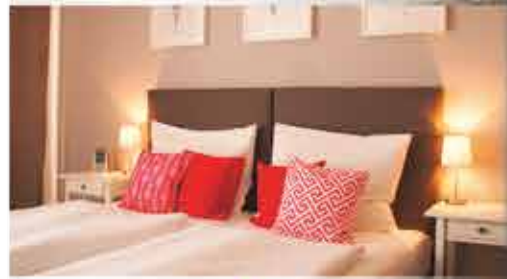
Zimmerbeispiel, 3+ Hotel Dein Franz