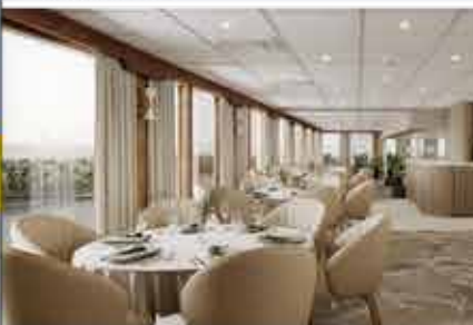
Restaurant, 4+ DCS Amethyst 1